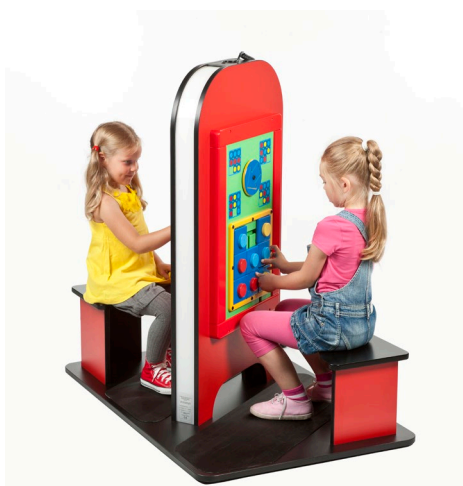
Doppelsitzer mit KeeBee Modul

Die Spielecke kann frei aufgestellt werden, ist von allen Seiten zugänglich und benötigt nur den Stellplatz einer Europalette. Sie benötigen lediglich eine 230V Steckdose. Die Kabelführung erfolgt wahlweise per Decken Spiralkabel oder Bodentank.