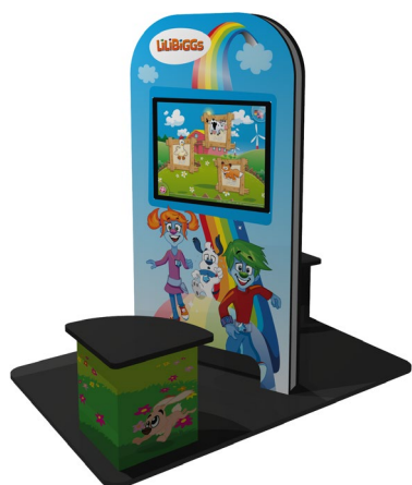
My KidsCorner Doppelsitzer CI