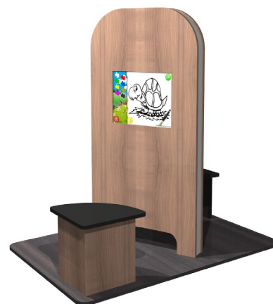
My KidsCorner Doppelsitzer CI