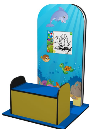
My KidsCorner mit Sitzbank Delphin