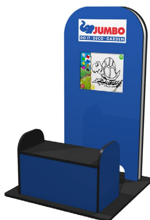
My KidsCorner mit Sitzbank CI