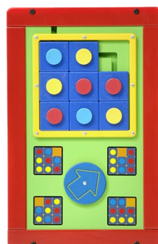
Tic Tac Toe