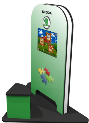
My KidsCorner Dreieck CI