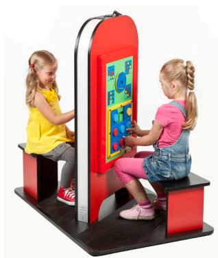
Doppelsitzer mit KeeBee Modul