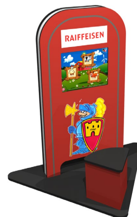
My KidsCorner Dreieck CI