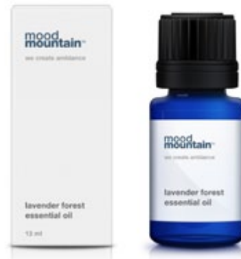
Ce qui compte est à l'intérieur.

Notre technologie de brumisation à froid préserve les senteurs mais également les propriétés antibactériennes de nos huiles. Ces fragrances sont parfaitement adaptés pour les Fitness, Spa, bureaux, Hôpitaux et Homes.